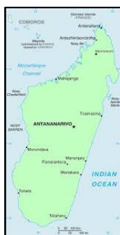
Carte de Madagascar

Notre objectif est de valoriser les PAVs ou Plantes à Valeurs Ajoutées Malgaches.